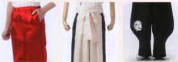
ポケットをつける