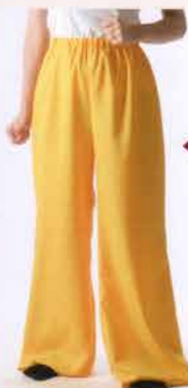
すそ上げはしていません