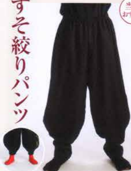
足裏にすそを入れることもできます。