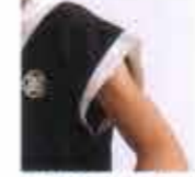
肩口フチあり(オプション)