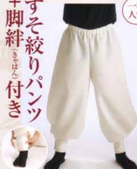
マジックテープで巻きます。