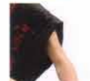
肩口芯入り(オプション)